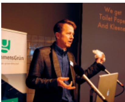
J Henry Fair, Photograph