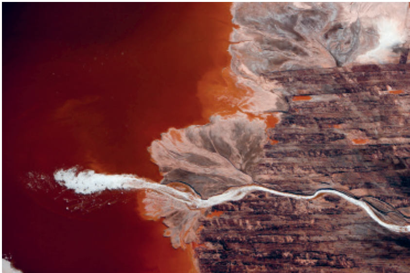
„Expectoration“ aus der Präsentation „industrial scars“ des Photographen J Henry Fair im Rahmen der Tagung „Sabotieren Subventionen unser Klima?“ am 15. November 2008, Zeche Zollverein, Essen, Seite 7 f.

Am Puls Berlins: UnternehmensGrün im Gespräch mit Bundestagsabgeordneten